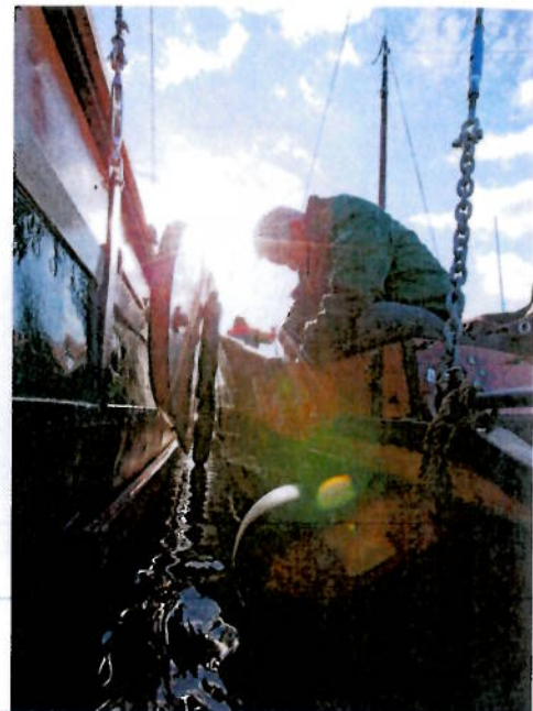
Een laatste controle voordat men het water opgaat; bij harde wind moet alles kloppen